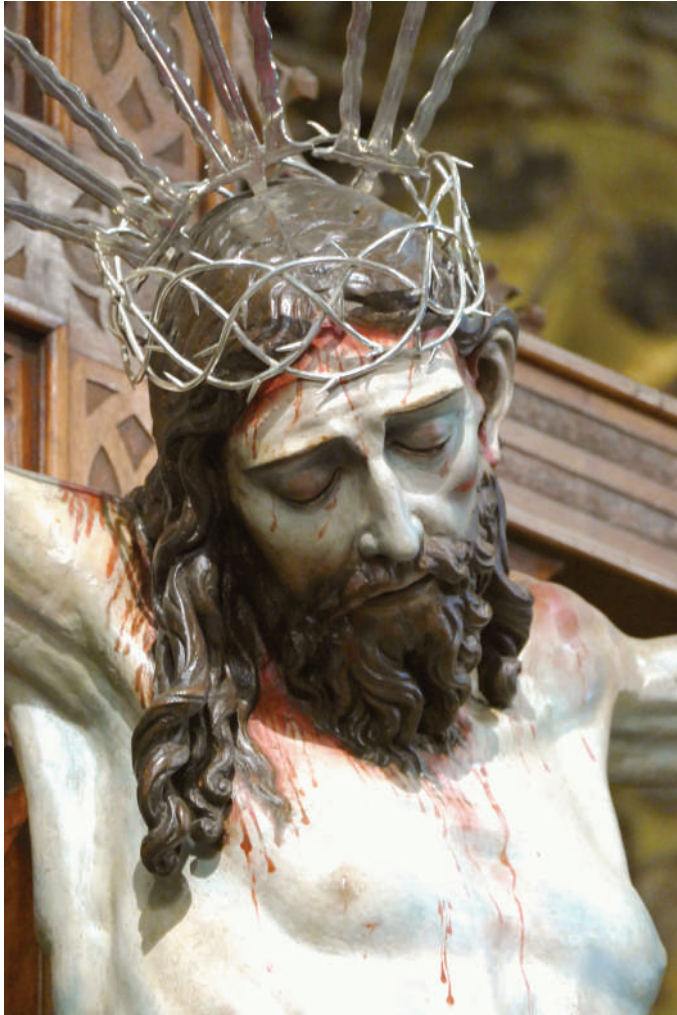
Lám 1. Imagen del Cristo del Rosario, referencia devocional de Zafra y de la presencia dominicana.

especialmente en los siglos XVIII y XIX y, en este último, lo haremos precisamente de la mano de las monjas de Santa Catalina, pues, a partir de la crónica del convento, nos introduciremos en dos acontecimientos trascendentales para la historia de la Orden: la exclaustración de 1835 y la posterior revolución de 1868 y la restauración de la provincia Bética en 1897. El problema metodológico de esta crónica es que sus páginas no están numeradas.