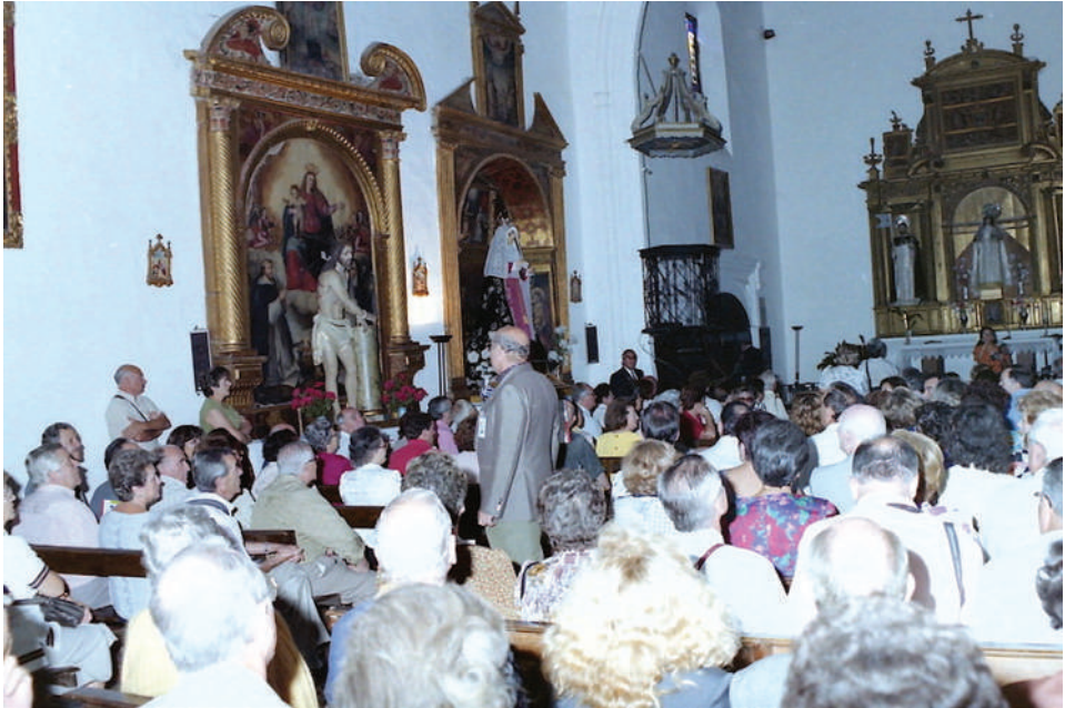
Lám. 5. Iglesia del convento de Santa Catalina de Siena (Zafra), poco antes de la clausura.