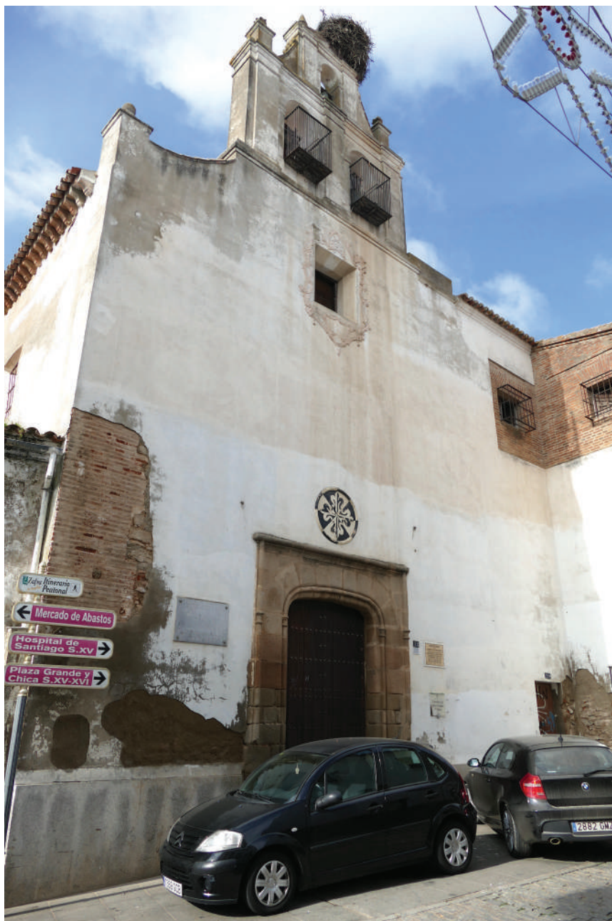
Lám. 4. Fachada del convento de Santa Catalina de Siena (Zafra) en la actualidad.