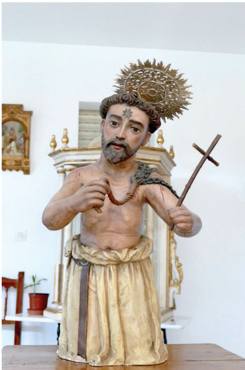
Lám. 2. Imagen de Santo Domingo penitente, que gozaba de gran devoción por parte de las monjas de Santa Catalina de Siena, hoy en la clausura del convento de Santa María de Gracia (Córdoba).