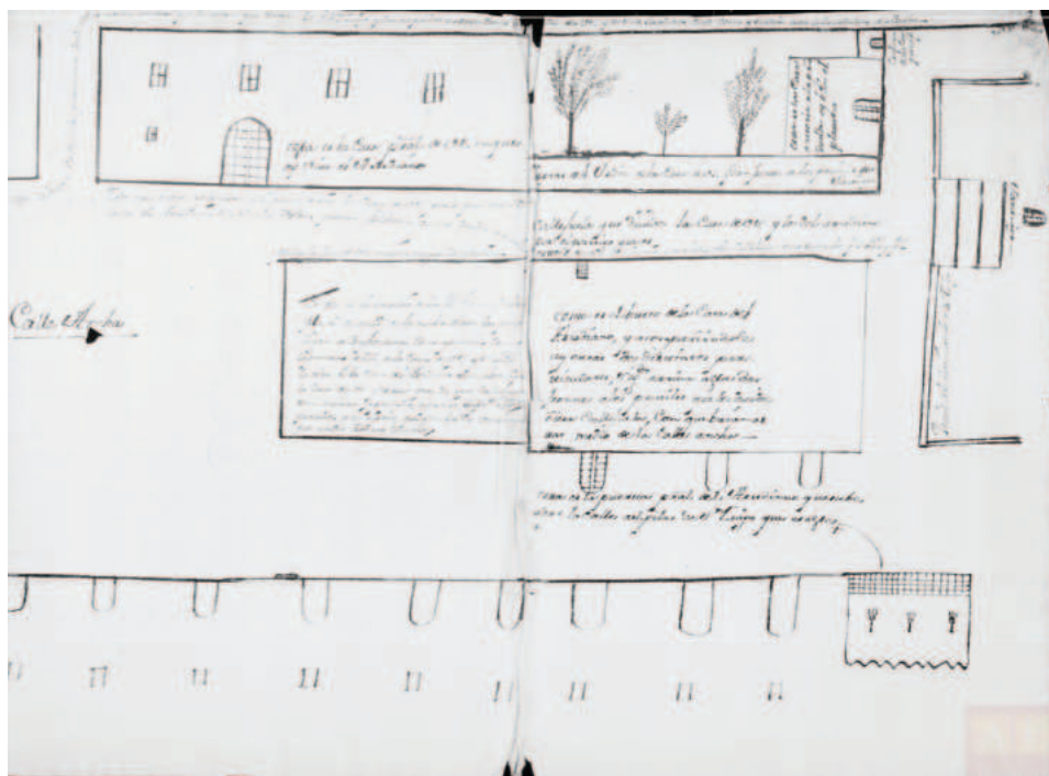
Fig. 7. Plano de situación de la casa del marqués de los Trujillos y la calle Ancha de Guadix (s. XVIII).

Tras las políticas urbanizadoras emprendidas a raíz de la desamortización este espacio se convertiría en una amplia explanada. Sin embargo, a finales del siglo XIX se hallaba en un estado bastante insalubre puesto que el pretil que rodeaba su amplio perímetro funcionaba casi como muralla lo que facilitaba que gran parte de los vecinos lo utilizaran como estercolero. Hubo voces allá por el año de 1893 de lo urgente que era adecuarlo. Proponían la composición de unas escalerillas de acceso a la puerta principal de la iglesia, y la creación de un jardín circular delante de la fachada en cuyo interior albergara la fuente de la Mona, en esos momentos ubicada en uno de los ángulos del antiguo compás de San Diego, y cuyo emplazamiento original había sido la plaza Mayor (García-Varela, 1893: 2-3). Sin duda alguna hubiera sido todo un acierto porque desde que esta se desmontó de su ubicación original perdió su función no sólo práctica sino señera dentro de la ciudad. El nombre popular le venía por el