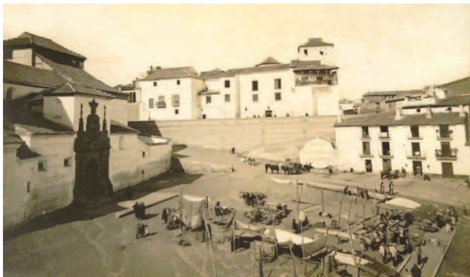
Fig. 8. Puestos de mercado instalados en la placeta de Santiago de Guadix (ca. 1909).

Finalmente, el edificio del mercado no llegaría a levantarse y habría que esperar algunos años tanto para verlo materializado, en concreto en 1928 en el lugar en el que hoy se emplaza, y para que definitivamente la placeta de Santiago dejara de albergar este tipo de concentración vecinal con todos los problemas que esto suponía tanto por su ubicación delante de la iglesia parroquial como del propio convento de las clarisas.