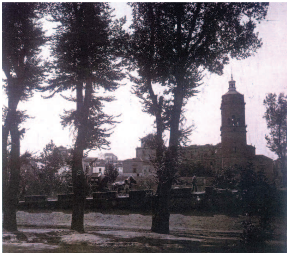
Fig.1. Vista de Guadix y su Catedral desde la carretera de Granada, según Arturo Cerdá (ca. 1900).

cuando una de estas iglesias parroquiales asumiría un papel clave en la configuración urbanística de la ciudad accitana por lo extenso del territorio de su feligresía ya que abarcaría hasta la zona de las cuevas. Nos referimos a la iglesia de Santiago creada no sólo como sede parroquial, sino sobre todo como espacio funerario. Las trazas del templo fueron dadas por Diego de Siloe en 1533 y a los pocos años asumiría el papel de iglesia conventual al añadirsele un edificio monástico colindante, convirtiéndose de esta manera también en templo conventual. Esto hizo que, a diferencia de otros edificios conventuales, la iglesia y convento de Santiago tuviera un papel mayor en las dinámicas cívicas y religiosas de Guadix que el resto.