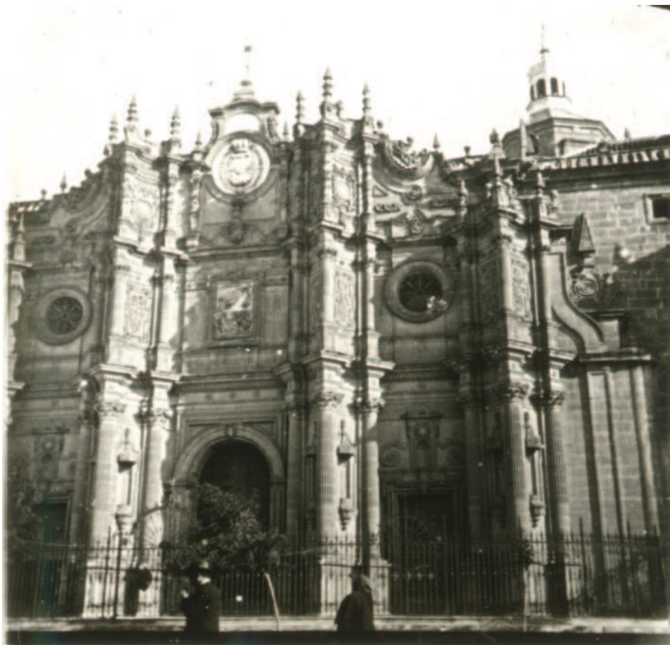
Fig.2. Fachada de la Catedral de Guadix, según Arturo Cerdá (ca. 1900).

despejados y visibles: la entrada a la plaza, el caño del Catalán y el paseo de los Canónigos. También se tuvo en cuenta que había que incorporar una escalinata fuera de la verja que facilitase el acceso al interior del templo.