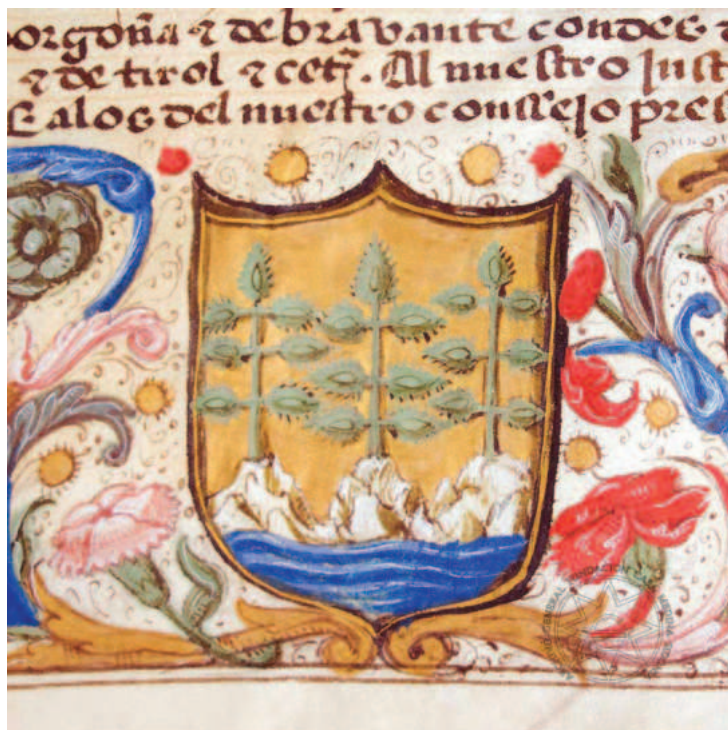
Lám. 2. Escudo de Pedro Fajardo, I marqués de los Vélez, en la ejecutoria ganada a la mujer de Íñigo López de Ayala, sobre la pertenencia de la jurisdicción civil y criminal del lugar de Campos, en el término de Mula (1537).

El castillo sería parte del escenario de los numerosos conflictos del segundo marqués don Luis con los vecinos de Vélez Blanco y la instrumentalización de los moriscos como grupo de presión, incluso después de la expulsión de 1570 por tener privilegio real (Vincent, 2006: 163-185; Guerrero, 2006; Andújar, 1996; Barrios & Andújar, 1999; Andújar, 1999; Andújar, 1995; Sánchez, 2002) 8 .