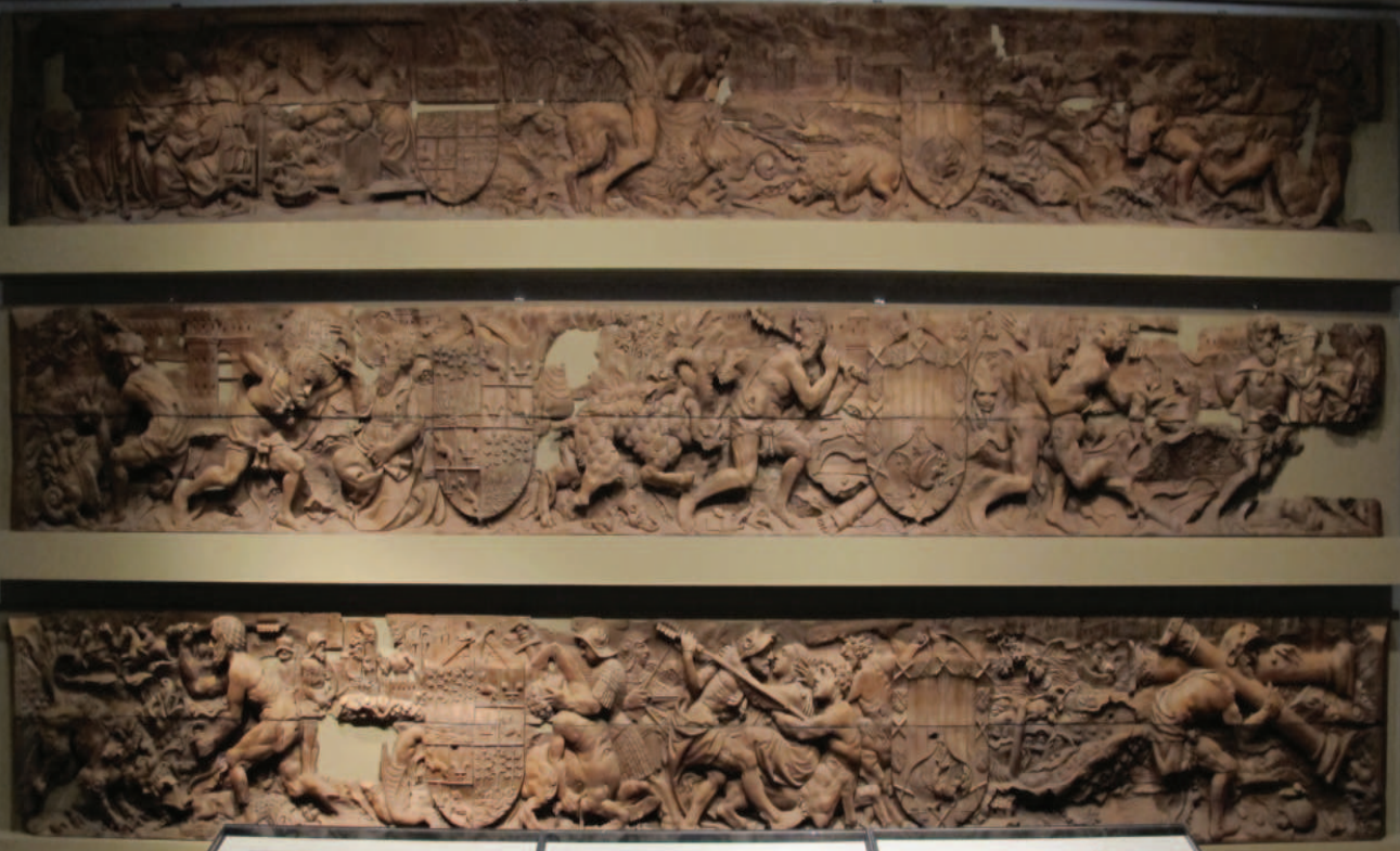
Lám. 6. Frisos con escenas de los Triunfos de Hércules, que adornaban uno de los salones del castillo de Vélez Blanco. Museo de Artes Decorativas, París.

de oro, de plata con diamantes, rubíes y el escudo del marqués, escribiéndole Anglería en una carta de 1507: "Cuéntase maravillas acerca de tus atuendos, elegancias y riquezas y las de tus acompañantes" (Marañón, 2005: 49). Entre los selectos enseres se encontraba mobiliario de maderas nobles y para un servicio conforme a la calidad de la casa, vajilla de plata, vidrio de Venecia y numerosas copas y jarras.