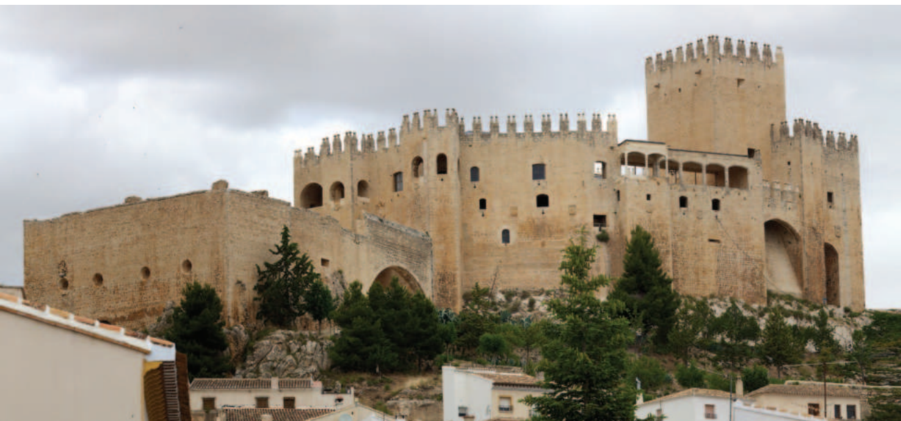
Lám. 4. Castillo de Vélez Blanco (Almería).

1657, permiten conocer el aspecto exterior y la distribución original y el uso de las dependencias del castillo (Roth, 2007b: 82-87). El primer recinto contenía las caballerizas, la cocina, la panadería y la casa de los Pajes. Desde allí se accedía a una estructura de madera asentada sobre pilares de obra y, el último tramo, un puente levadizo accionado por un fuerte torno. Las puertas estaban cubiertas de planchas de hierro, accediendo al zaguán y un cuerpo de guardia a mano derecha.