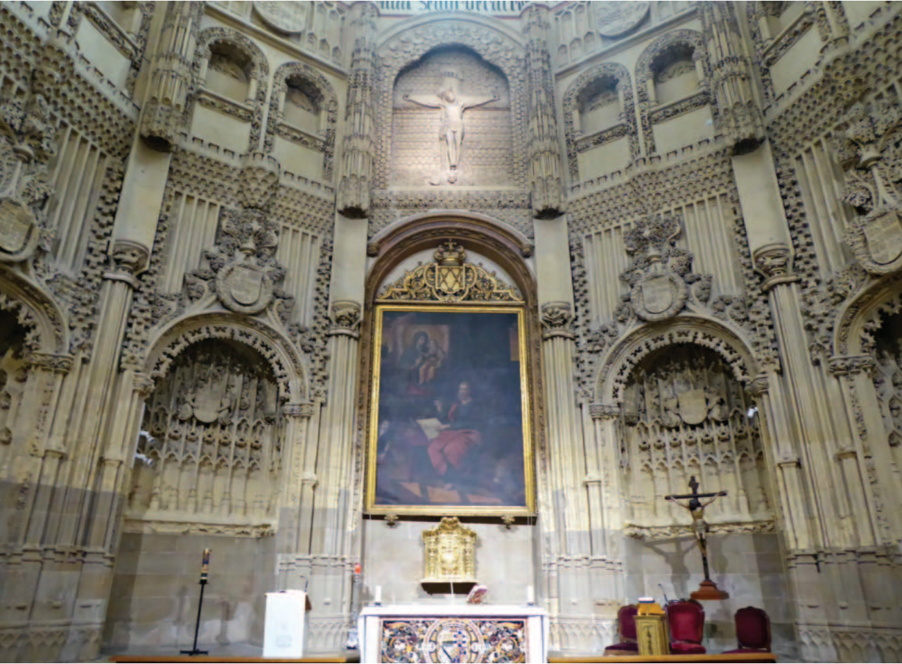
Lám. 1. Capilla de San Lucas o de los Vélez (1507). Catedral de Murcia.