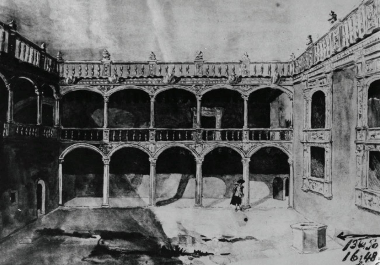
Lám. 9. Dibujo del patio del castillo de Vélez Blanco, antes de su desmonte (1904).