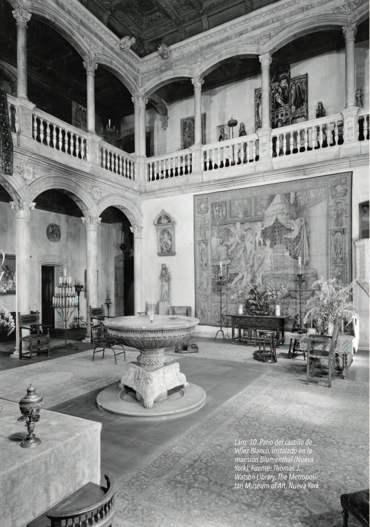
Lám. 10. Patio del castillo de Vélez Blanco, instalado en la mansión Blumenthal (Nueva York).