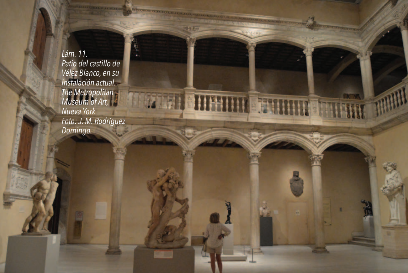
Lám. 11. Patio del castillo de Vélez Blanco, en su instalación actual. The Metropolitan Museum of Art, Nueva York.

de titularidad pública. Durante casi dos años miles de personas apoyaron con su firma y con actos reivindicativos la compra del castillo por parte de la Administración pública (Lentisco, 2007a: 414-427). Todavía el 16 de diciembre de 2007, el diario Ideal titulaba "Los frisos del castillo de Vélez Blanco llegan a Almería".