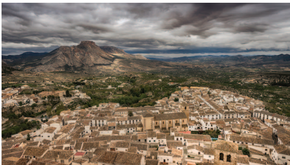
Lám. 3. Panorámica del centro urbano de Vélez Blanco, desde el castillo. En el centro, iglesia parroquial de Santiago y calle de la Corredera; y a la izquierda, el convento de San Luis Obispo.

La impronta urbanística de los Fajardo en su capital terminaría con la construcción de la ermita de la Concepción (1573-1577) y, como protectores de la Orden franciscana en su provincia de Cartagena, del convento de San Luis Obispo (1602-1615), constituyendo esta comunidad regular también un importante contrapeso político a la universidad de beneficiados de la iglesia de Santiago, durante decenios en oposición al marqués (Roth, 2008).