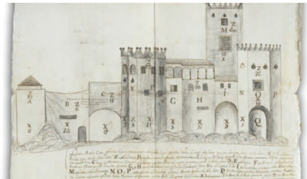
Lám. 5. Alzado del castillo de Vélez Blanco (s. XVIII).