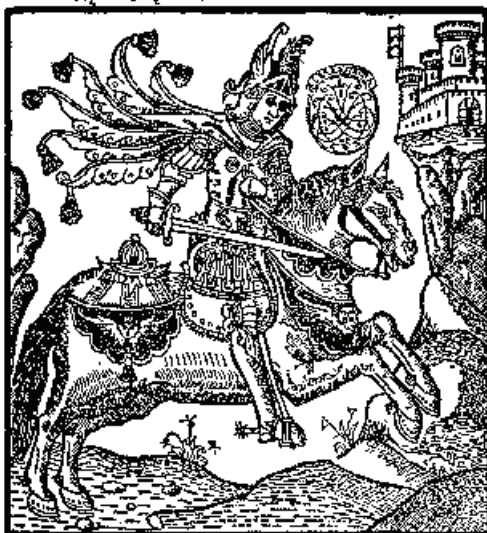
Lám. 7. Portada del Floriseo (1516), obra de Hernando Bernal dedicada a Pedro Fajardo y Chacón, I marqués de los Vélez.