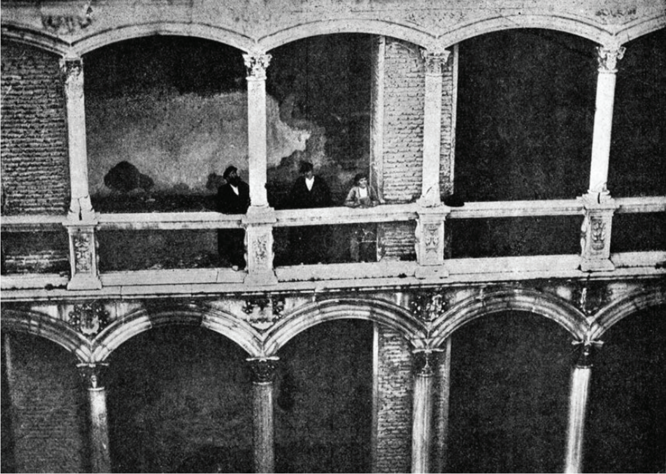
Lám. 8. Patio del castillo de Vélez Blanco, antes de su desmonte (1881).

un picadero en la explanada 33 ; mientras que la ermita de la Magdalena se había derrumbado a principios del siglo XIX.