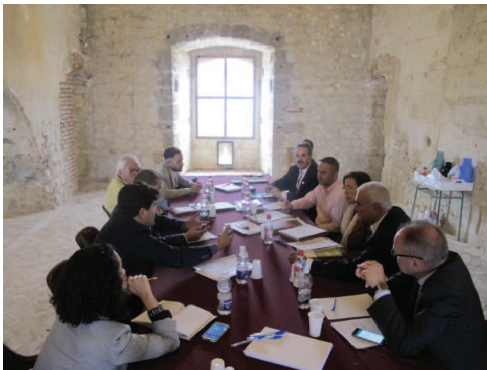
Lám. 12. Segunda reunión de la comisión de seguimiento del convenio para la reconstrucción del patio del castillo de Vélez Blanco, celebrada en el interior de la fortaleza (mayo de 2016).

2018 Salmerón presentó a la comisión de seguimiento el proyecto básico para la reconstrucción del patio de honor. También se solicitó desde el Ayuntamiento de Vélez Blanco la reproducción de los frisos y la digitalización de la biblioteca de los marqueses de los Vélez custodiada en la biblioteca del monasterio de San Lorenzo del Escorial.