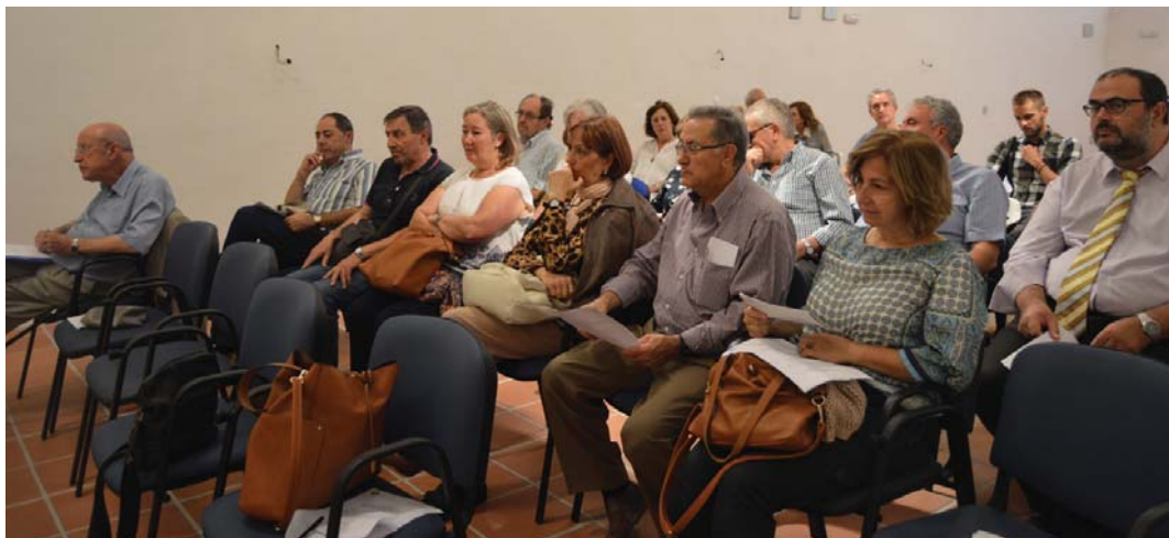
Asamblea general celebrada en Cortes y Graena.

La Asamblea General del Centro de Estudios, en su convocatoria ordinaria, tuvo lugar el 1 de octubre de 2016, en el Centro de Interpretación de Los Covarrones de Cortes y Graena, amablemente dispuesto por el Ayuntamiento de la localidad para esta ocasión. Durante la reunión plenaria se aprobó por unanimidad la memoria de la gestión anual correspondiente al curso 2015-2016, la memoria de actividades desarrolladas durante el citado curso, el estado de cuentas y la propuesta de actividades para el curso 2016-2017; igualmente se procedió a la votación de candidaturas que optaron al Premio Pedro Suárez 2016.