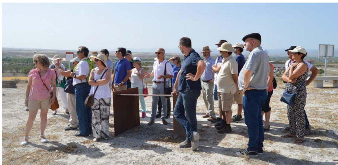
Visita a los yacimientos arqueológicos de Basti (Cerro Cepero, Baza).

Como actividad encaminada al conocimiento del territorio, el Centro de Estudios desarrolló el pasado 9 de julio de 2016 una visita de campo a los yacimientos arqueológicos de Cerro del Santuario y Cerro Cepero en Baza. A lo largo de la jornada, los miembros asistentes pudieron conocer el Centro de Interpretación de los Yacimientos Arqueológicos de Basti (CIYAB), el claustro del convento de San-