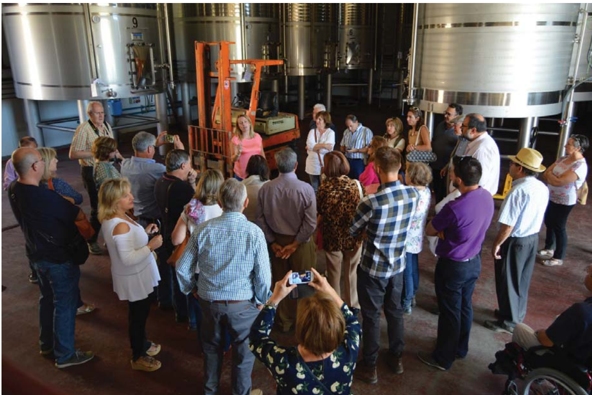
Visita a las Bodegas Muñana (Graena).