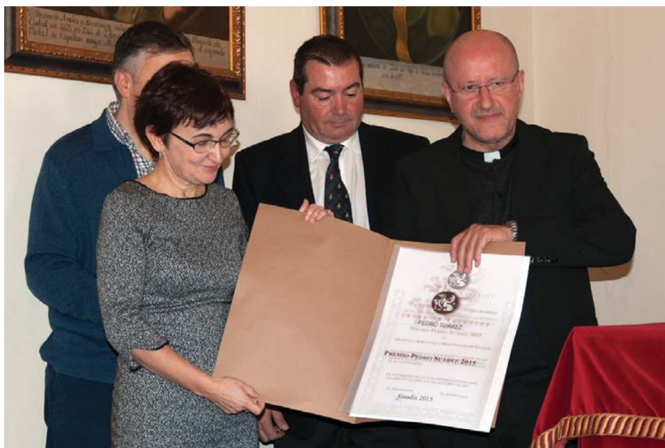
El director y personal del Archivo y Biblioteca Diocesanos de Guadix recogen el Premio Padre Suárez 2015.

El 31 de octubre de 2015 tuvo lugar la entrega del Premio Pedro Suárez 2015 al Archivo Histórico y Biblioteca Diocesanos de Guadix, con el que se destaca el impulso de la Diócesis de Guadix a un proyecto que ha contado con la concurrencia de diferentes entidades e instituciones, con objeto de preservar el principal legado documental del norte de Granada. Igualmente relevante es la recuperación patrimonial que ha supuesto en este proceso la rehabilitación de la antigua iglesia de La Magdalena.