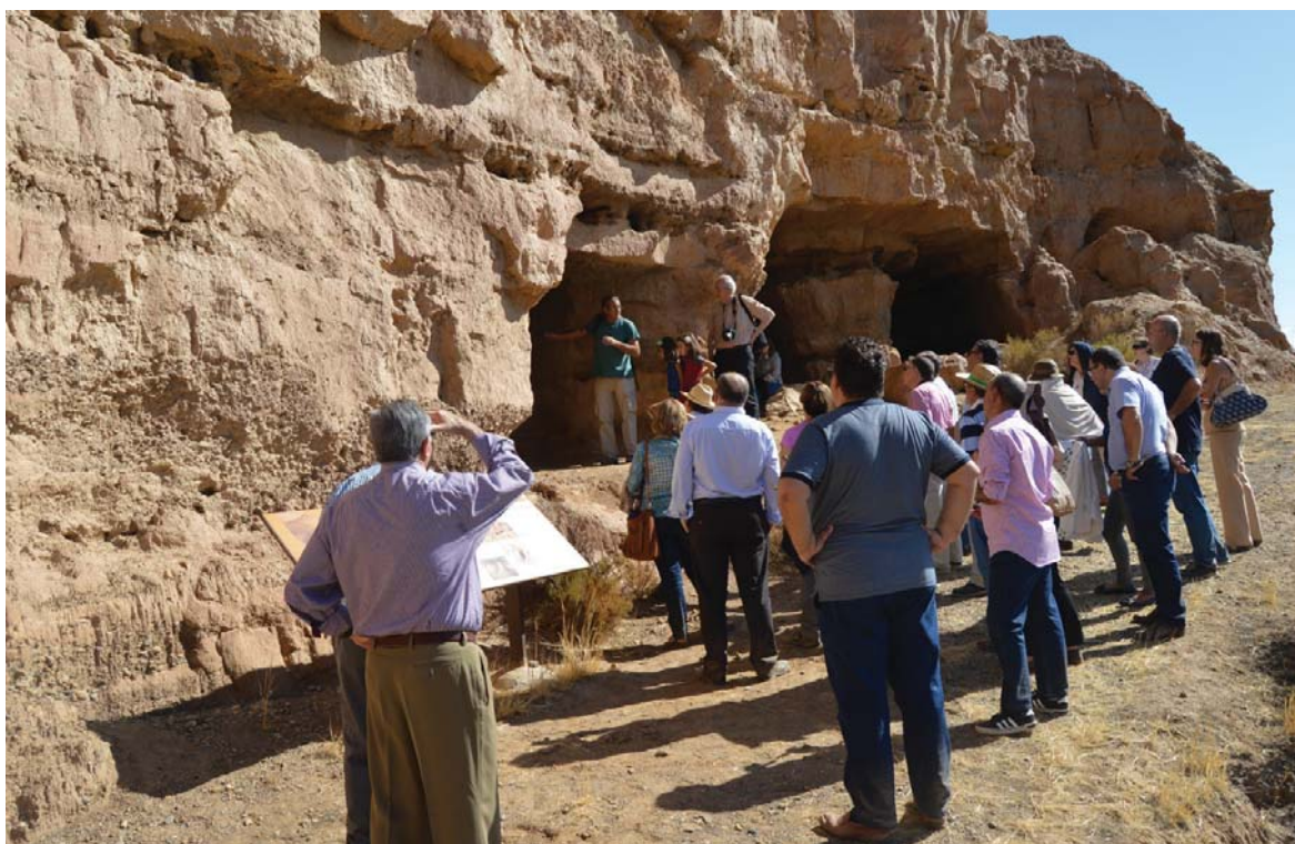
Visita a los yacimientos arqueológicos de Basti (Cerro Cepero, Baza).