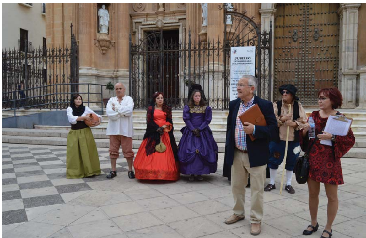
Visita por el Guadix literario.